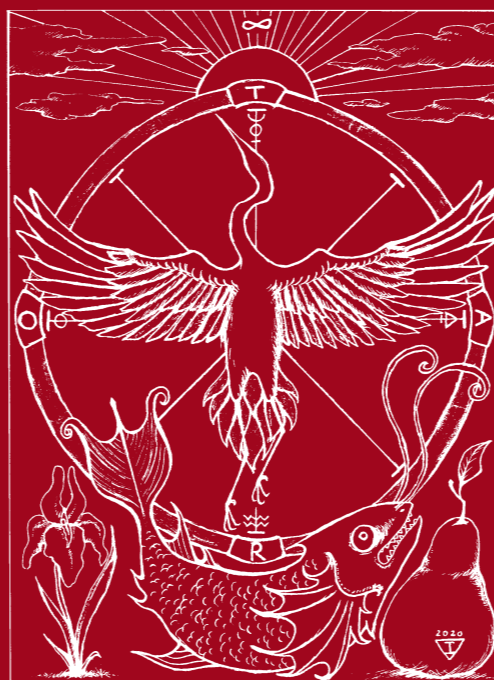
Ilustração de Iris Martin Pereira

TUDO TEM VOLTA E O TEMPO LHE DÁ AS CORES